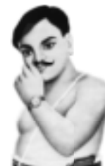
À LA RECHERCHE DU TEMPS PERDU